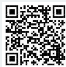
会计学术联盟直播