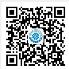
会计学术联盟微信公众号